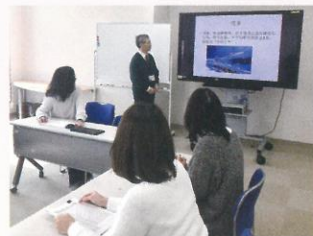
通訳案内士講座 [15回] ¥ 23,000 (税込)