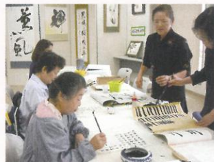
中国書道講座 [15回] ¥ 15,000 (税込)