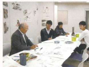
中国画講座 [15回] ¥ 23,000 (税込)