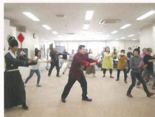
太極拳講座 [15回] ¥ 15,000 (税込)